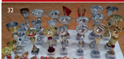
Pokale + Wiener Landesmeistermedaillen