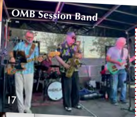
OMB Session Band

Infopoints: WAT 20, JG, SJ, SPÖ Brigittenau, Volkshoch- schule Brigittenau, Naturfreunde, Grätzpolizei, Gewerkschaft SPÖ, Wiener Gewässer, Wien Energie, Arbeiter Samariterbund