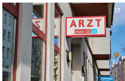
Barrierefreie Gruppenpraxis für Allgemeinmedizin „med-20.at“