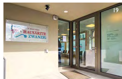
Primärversorgungszentrum „Hausärzte Zwanzig“

Auch das Netz der niedergelassenen Fachärzt:innen und Diagnosezentren ist ein unverzichtbarer Bestandteil der medizinischen Betreuung in der Brigittenau.